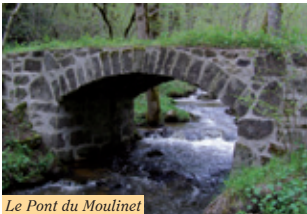
Le Pont du Moulinet

D Depuis la place du Vernet-la-Varenne, emprunter la route à gauche des panneaux de départ. Au carrefour, continuer en face pour longer l'église par la gauche. Emprunter ensuite le « Chemin des Nations » en face. Au carrefour en T, continuer tout droit, prendre le tournant à gauche et emprunter la première route goudronnée sur la droite. La route devient chemin. Poursuivre sur le chemin principal jusqu'au village de « la Faye ».